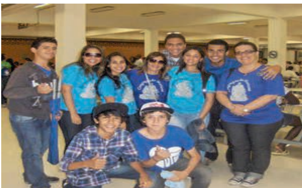
Romaria da Congreg. Mariana à Aparecida